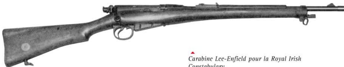
▲ Carabine Lee-Enfield pour la Royal Irish Constabulary