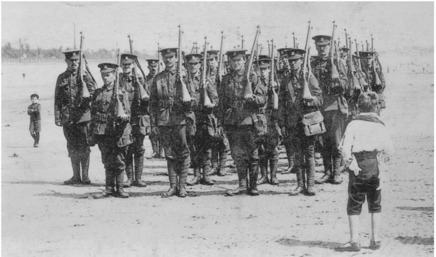
▲ Troupes anglaises débarquant en France en 1914, elles sont armées du fusil long Lee-Enfield

Le canon est renforcé au niveau de son assemblage sur la boîte de culasse. Il comporte des pans, et sur le pan supérieur est frappée la lettre E pour rayures système Enfield.