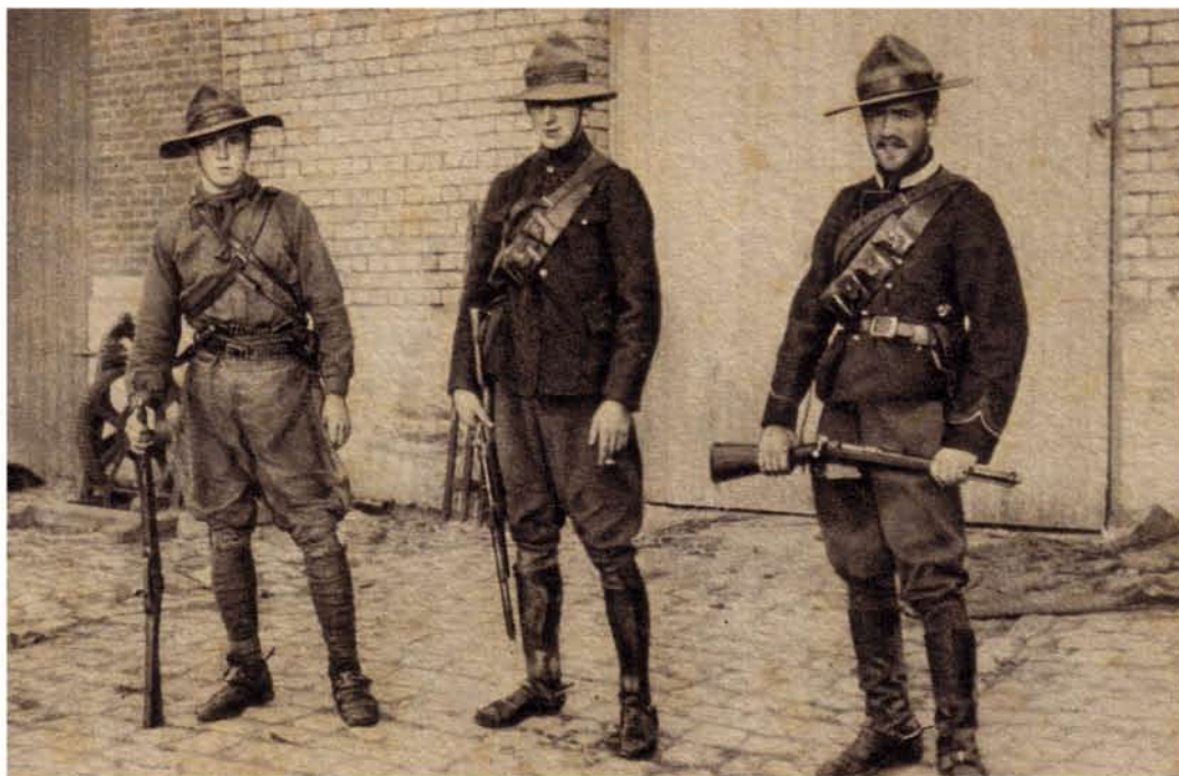
▲ Cavaliers canadiens armés de carabines Lee-Enfield