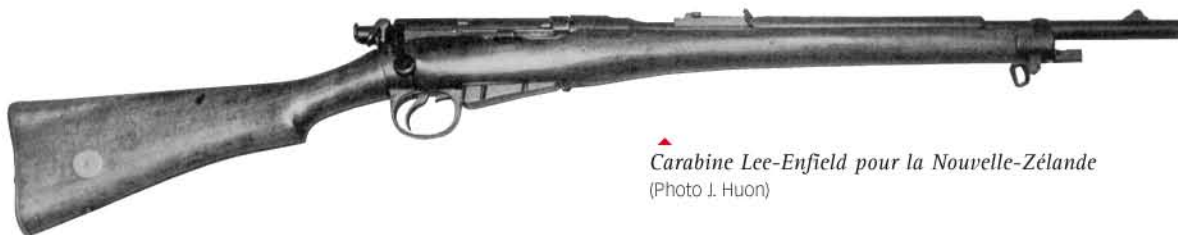
▲ Carabine Lee-Enfield pour la Nouvelle-Zélande