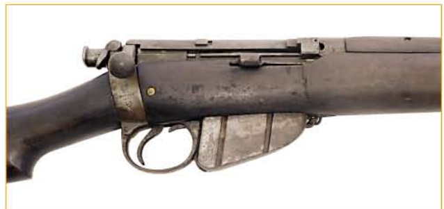
▲ Lee-Enfield Mark I*, avec chien armé et sûreté effacée