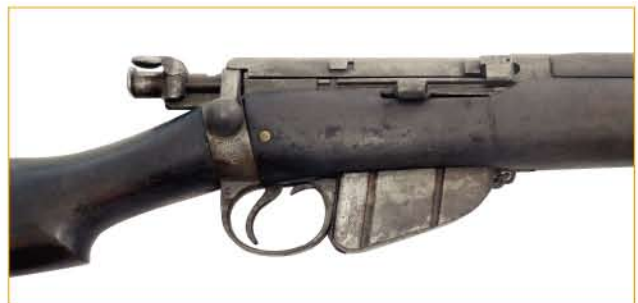
▲ Lee-Enfield Mark I*, avec chien armé et sûreté engagée

Ce fusil fut réalisé à plus de 590 000 exemplaires.